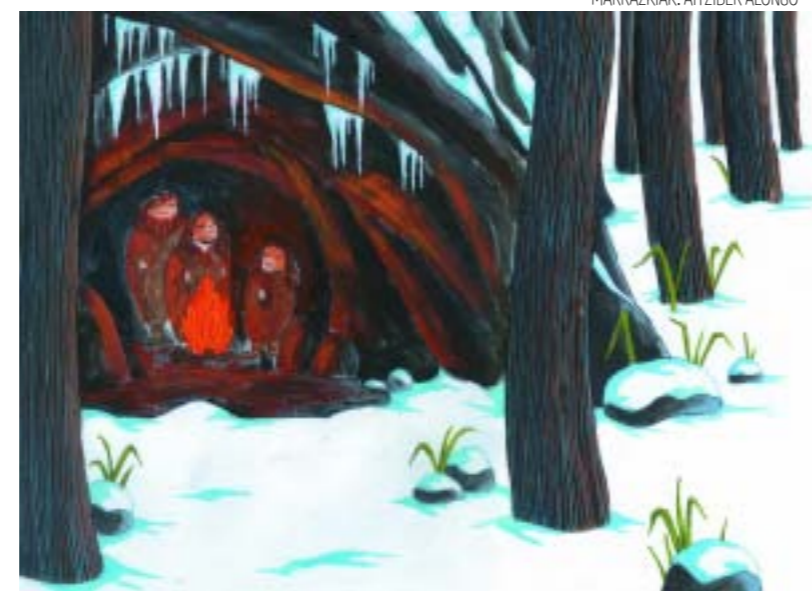
MARRAZKIAK: AITZIBER ALONSO

pian. Mundu bat. Lurpeko mundu misterioitsu eta eder hori ezagutaraztea da Felix Ugarte espeleologo elkartearen nahia. Urteak daramatza elkarteak Lurra barrutik aztertzen eta aztertutako jendeari erakusten. Lur planetaren barrunbeak ezkututzen duena gaztetxoei erakusteko, Mendien misterioak izeneko liburua argitaratu du elkarteak. Kutxak, Gipuzkoako Foru Aldun-